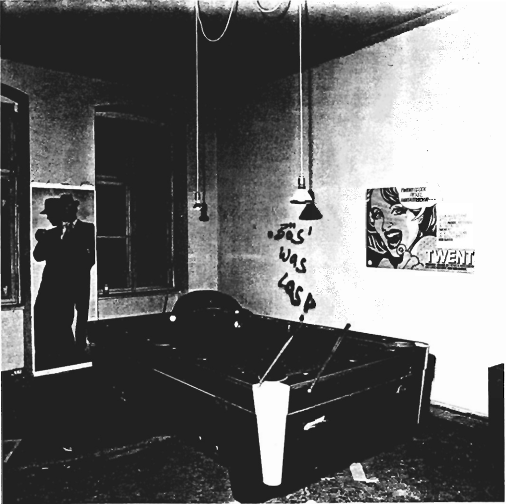
Berlin 1984.

ten Vorstellung, noch bevor sein Gesicht sich dem Publikum eingepägt hat. Umgekehrt aber, und darauf kommt es hier an, fixiert der Star eine Ästhetik. Ob erfunden oder aus dem Strom subkultureller Produktionen entnommen, identifiziert er eine bestimmte Ästhetik mit seinem Namen und macht sie kommunizierbar, unabhängig davon, ob es vorher einen Begriff für sie gab oder nicht. Das »Sieht aus wie Boy George« funktioniert so zuverlässig wie ein Etikett für das outfit selbst. Vielleicht sogar zuverlässiger, denn mit dem Star gerät ein Ganzes in den Blick, das nicht wie ein Etikett Abstraktion verlangt, sondern konkret-ästhetisch bleibt.