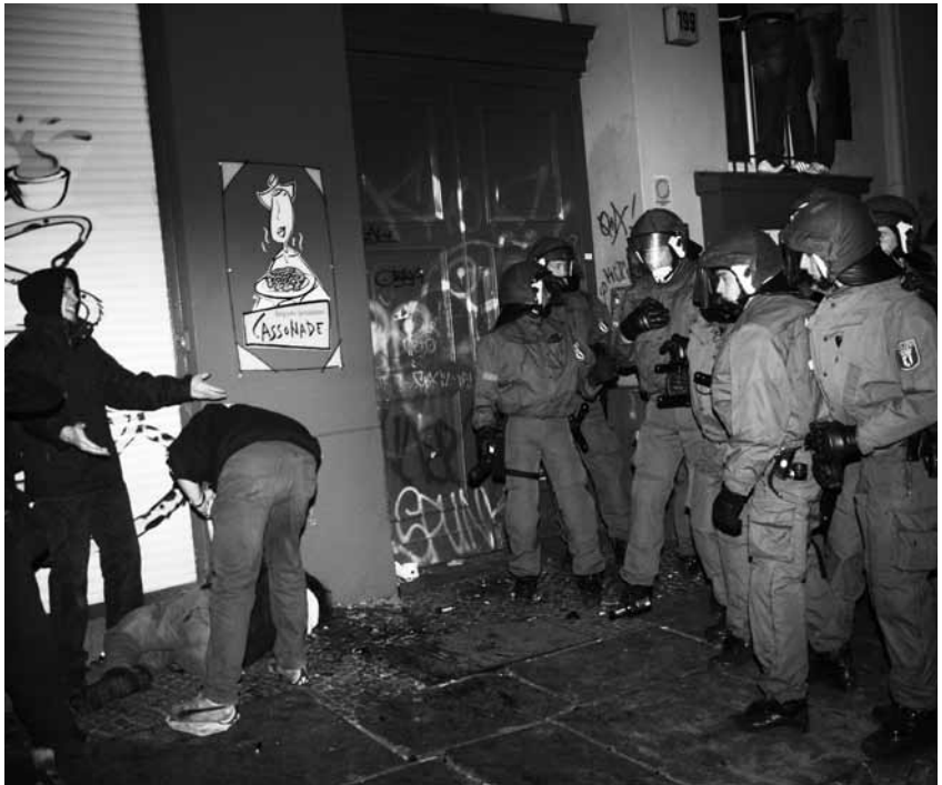
Die 30-jährige AW liegt in der Nacht zum 1. Mai in der Berliner Oranienstraße verletzt am Boden, nachdem sie von einem Polizeibeamten mutmaßlich mit dem Schlagstock geschlagen wurde. Seine zwölf anwesenden Kollegen sagten später übereinstimmend aus, den Angriff nicht gesehen zu haben.