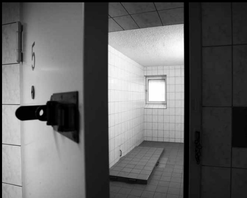
Die Verwahrzelle des Polizeireviere Dessau, in der Oury Jalloh, ein Asylbewerber aus Sierra Leone, im Januar 2005 unter bislang ungeklärten Umständen verbrannte.