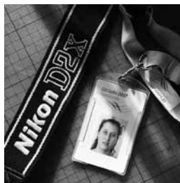
Der Presseausweis von KI, den sie während des mutmaßlichen Angriffs durch Polizeibeamte zeigte.