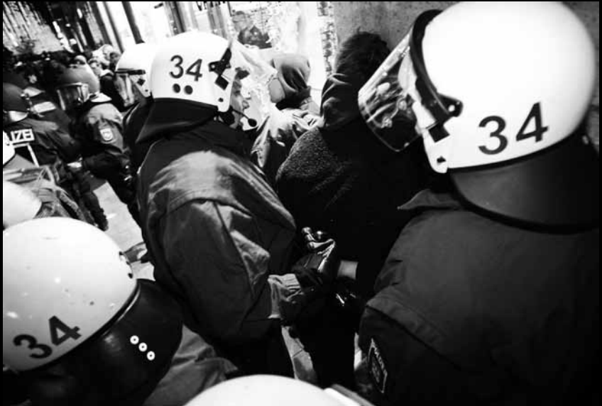
Polizisten der Einheit 34 führen in der Hamburger Innenstadt einen festgenommenen Demonstranten ab, Dezember 2009.