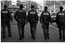
Polizeibeamte patrouillieren durch die Leipziger Innenstadt, März 2008.

Des Weiteren fordert Amnesty International die Behörden dazu auf, umgehend Maßnahmen zu ergreifen, die eine einfache Identifizierung von Polizeibeamten bei der Ausübung ihrer gesetzlichen Pflichten (einschließlich Festnahme, Ingewahrsamnahme und Anwendung von Gewalt) gewährleisten.