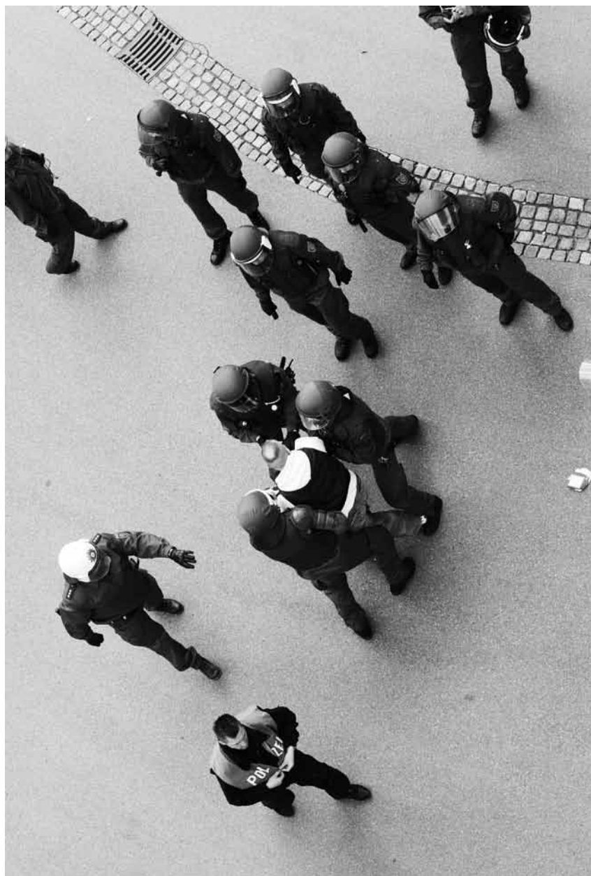
Polizeiaktion am Rande eines Fußballspiels, Aue 2006.