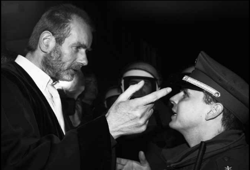
Der Richter Manfred Steinhoff spricht im Dezember 2008 vor dem Landgericht in Dessau am Rande des Prozesses um den Tod von Oury Jalloh mit Polizisten. Die beiden angeklagten Polizisten wurden knapp vier Jahre nach dem Tod des Asylbewerbers freigesprochen. Im Gerichtssaal kam es zu Tumulten.