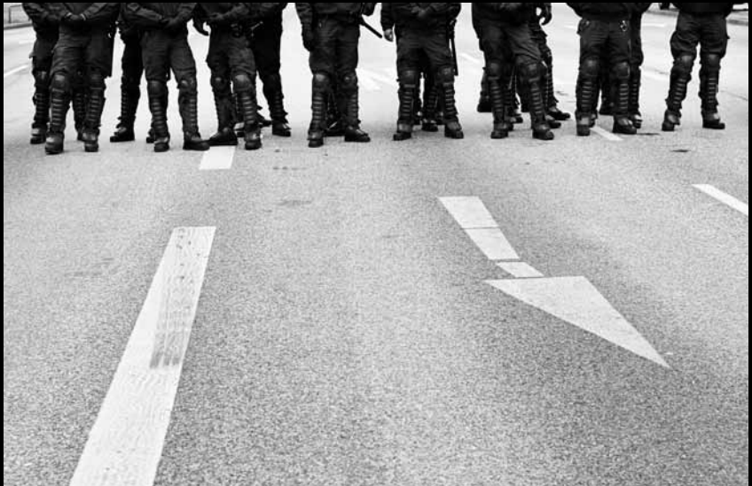
Straßensperre bei Demonstration gegen den ASEM-Gipfel vor G8-Gipfel, Hamburg 2007.