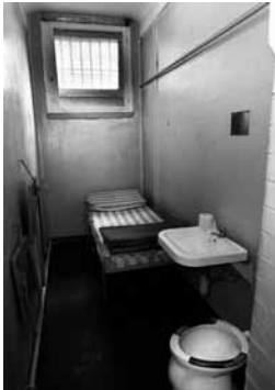
Blick in eine Zelle des Polizeigewahrsams in Frankfurt am Main, 1996.