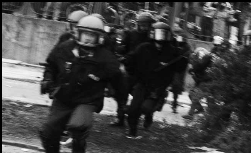
Heranstürmende Polizeibeamte beim G8-Gipfel in Heiligendamm. Fotografiert von der Fotojournalistin KI, bevor sie von einem oder mehreren der Beamten mutmaßlich mit Schlagstöcken geschlagen wurde, Juni 2007.